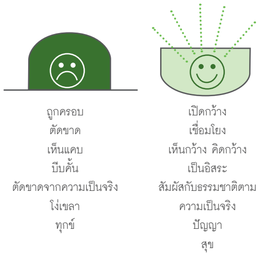
รูปที่ ๑ เปรียบเทียบจิตคว้ากับจิตหงาย

กะลา หรือภาชนะเดียวกัน เมื่อคว่ำหรือหงายมีคุณสมบัติต่างกันลิบลับ ลองดูรูปข้างล่าง สภาวะคว่ำ คือการครอบ เมื่อถูกครอบก็ทำให้ตัดขาด